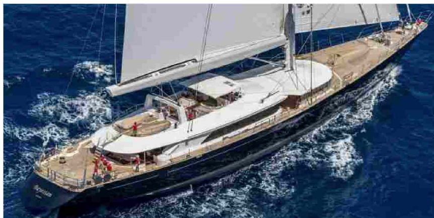
Affondamento veliero Bayesian al largo di Palermo

Giovanna Tedde — Pubblicato 27 Agosto 2024